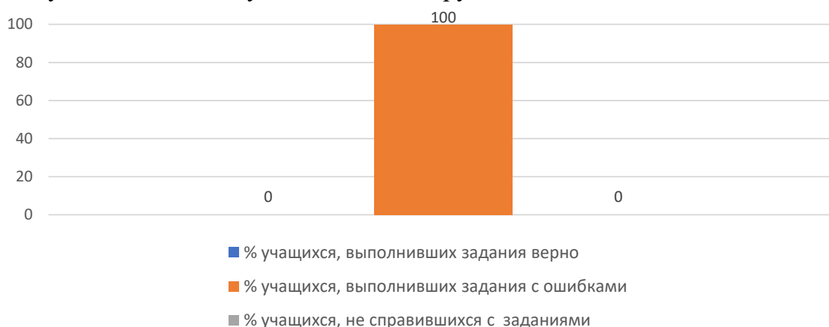
Рисунок 3. Основные результаты ДР по английскому языку

На рисунке 3 представлены основные результаты ДР по английскому языку в Ханкайском муниципальном округе.